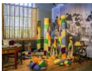
Installation. Création Krystel Chavigny et Birgit Nägelke 2017, présentée au sein de l'exposition permanente à l'atelier de garnissage.

De la Mongolie à l'Europe, l'Atelier-Musée propose un grand voyage à la découverte du feutre. Une centaine de créations contemporaines sont présentées dans l'ancienne chaufferie ainsi que dans l'exposition permanente, mettant en lumière les artisans feutriers, stylistes et artistes qui par leurs créations témoignent des nombreuses possibilités qu'offre ce matériau.